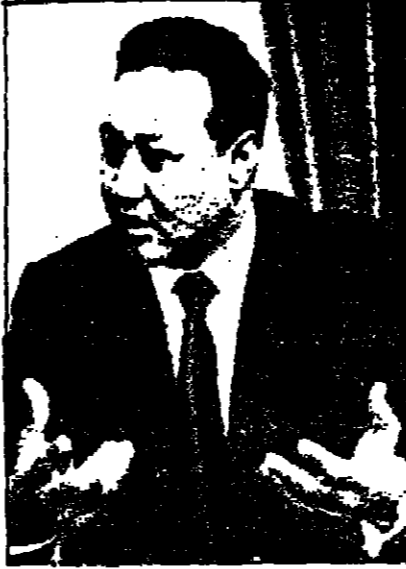
الرئيس جعفر النميري

كان المؤتمر الثالث للاتحاد الاشتراكي السوداني «الحزب الوحيد» قد أوصى في أواخر شهر كانون ثاني الماضي بتقسيم السودان إلى ست مناطق: المنطقة الجنوبية التي تقسم بالحكم الذاتي منذ ١٩٧٢ حتى كما هي، وهي تستغل على ستة أقاليم. أما الشمال فقد قسم إلى خمس أقاليم يكون في كل منها حكومة محلية: المنطقة المتوسطة «الجزيرة» - النيل الأبيض - النيل الأزرق. « المنطقة الشمالية » الشمال والنيل « المنطقة الغربية (كردفان الشمالي كردفان الجنوبي) » - منطقة دارفور « الشمالي والجنوبي » والمنطقة الشرقية « البحر الأحمر » - « شمال » - وتقرر أن تبقى الخرطوم العاصمة الوطنية ومقر الحكومة المركزية.